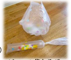
ビニール袋あそび